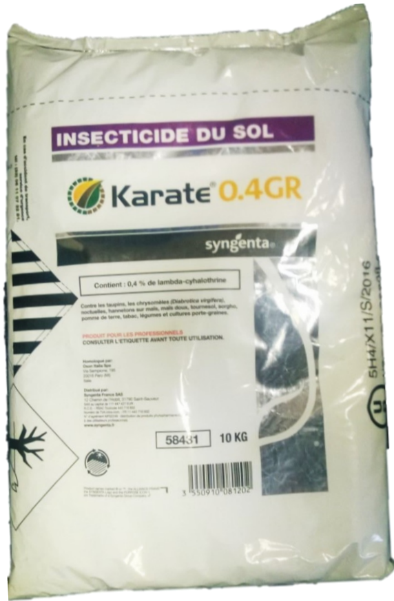
10 KG „Soft Bags“